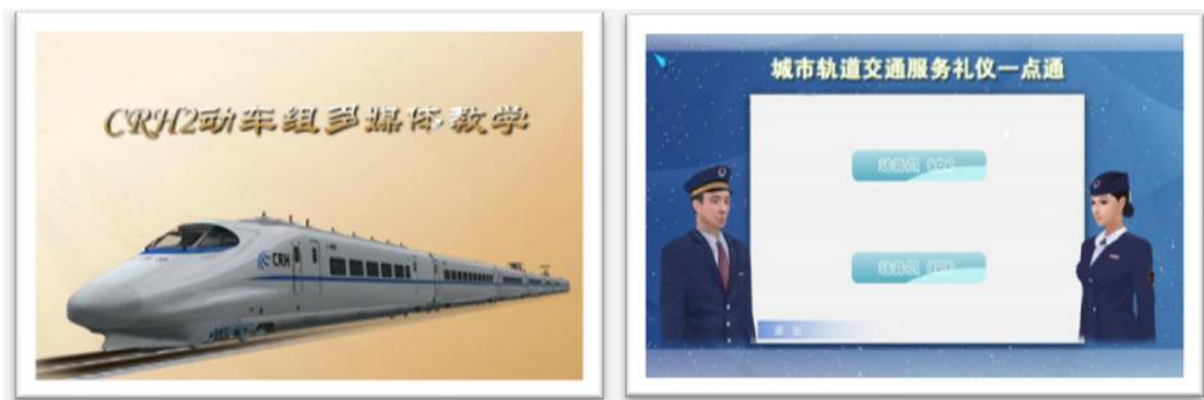
图 3 专业数字资源